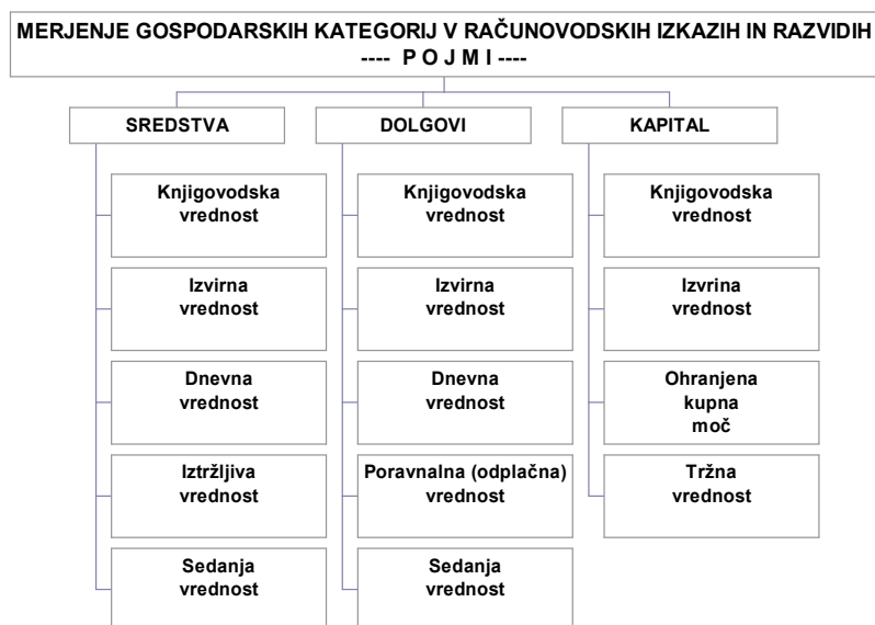
Slika 3: Merjenje gospodarskih kategorij v računovodskih izkazih in razvidih – pojmi

Prikazani pojmi so podrobno obravnavani v Slovenskih računovodskih standardih, zato ne ponavljam. Pomembno pa je, da standardi uvajajo pravila oblikovanja knjigovodske vrednosti. Ta so: