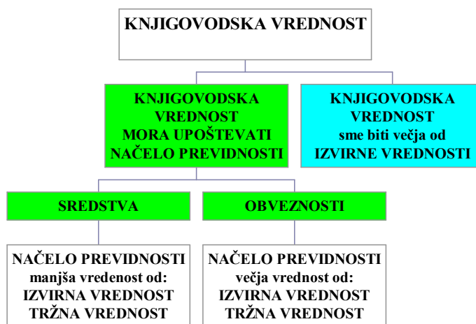
Slika 4: Knjigovodska vrednost

Načelo previdnosti smo poznali že doslej. Knjigovodska vrednost sme biti večja od izvirne vrednosti . To je novost. Oblike in vsebine prevrednotevanj prikazujem v spodnji sliki: